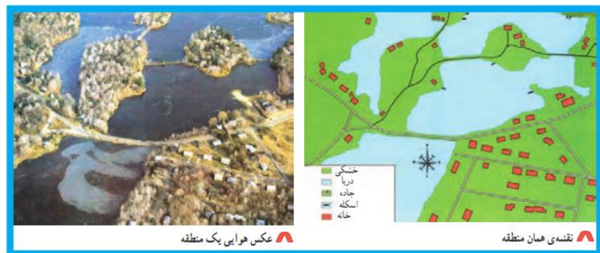
عکس هوایی یک منطقه