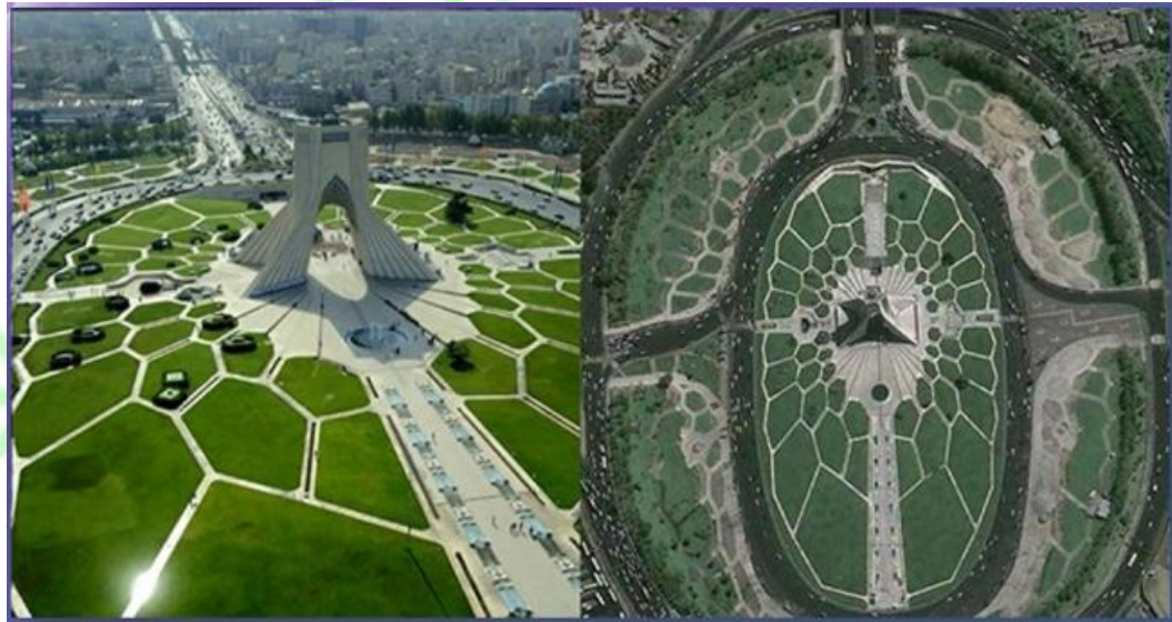
عکس از روبه رو