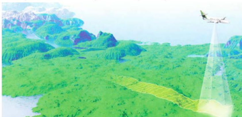
هواپیما در حال عکس برداری از یک منطقه